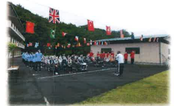
運動会の様子です

引き続きオンライン面会のみに対応となっております。ご家族の皆様にはご不便、ご迷惑をおかけ致しますがご理解・ご協力をよろしくお願い致します。