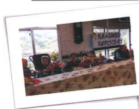
4月の誕生会の様子です。

新型コロナウイルスワクチン接種へのご協力ありがとうございます。高齢者に対するワクチン接種について延岡市より、高齢者施設でも4月中旬からワクチン接種が出来るよう準備を進めております。また、ワクチンの供給量が約2000人分と少ない為、先行接種する施設を医師会と選定し、調整を行っております。その後、追加のワクチンが確保され次第、対象とする施設を随時拡充していく予定です。ワクチンの供給があり次第、各施設へ連絡がくるとの予定です。