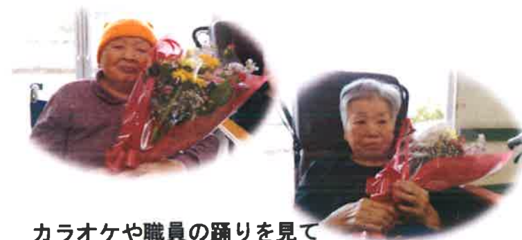
カラオケや職員の踊りを見て 楽しめました！

引き続きオンライン面会のみに対応となっております。お家族の皆様にはご不便、ご迷惑をおかけ致しますがご理解・ご協力をよろしくお願い致します。