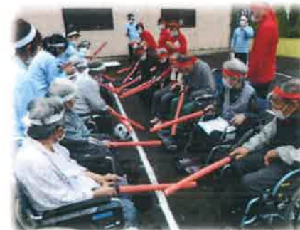
玉入れなどをして楽しめました