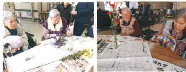
活動の生花の様子です。思い思いに飾っております。